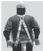
3. Colóquese el arnés como si fuera un chaleco; la anilla "D" debe quedar en la espalda y al centro de los hombros.