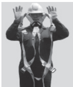
2. Sostenga el arnés de las correas de los hombros.