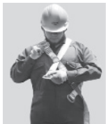
1. Abroche la hebilla que queda a la altura del pecho.