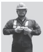
1. Abroche la hebilla que queda a la altura del pecho.