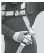
3. Regule todas las hebillas de tal forma que quepa una mano apretada entre la ropa y las correas.