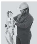
1. Tómelo de la anilla "D" que se encuentra entre las etiquetas de marca y las instrucciones