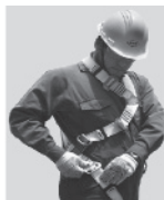
3. Abroche las hebillas que cuelgan a la altura de las piernas y proceda a regular.