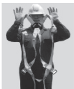
2. Sostenga el arnés de las correas de los hombros.