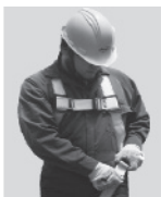
2. Abroche las correas que cuelgan a la altura de las piernas.