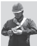
2. Abroche la hebilla que está a la altura de la cadera.