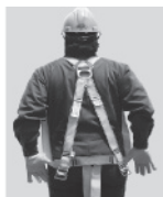
3. Colóquese el arnés como si fuera un chaleco; la anilla "D" debe quedar en la espalda y al centro de los hombros.