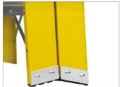
3 Zapatas Antideslizantes