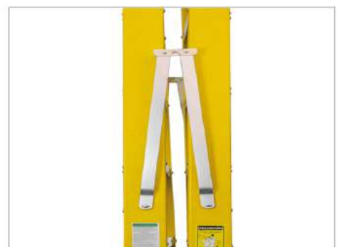
4 Abrazaderas de Posicionamiento