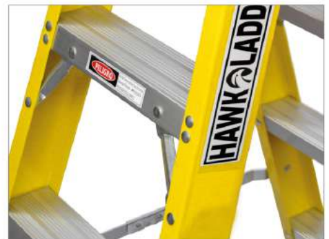
2 Doble Remache de Seguridad