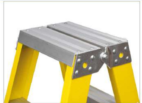
1 Plataforma Inoxdable Extra Reforzada