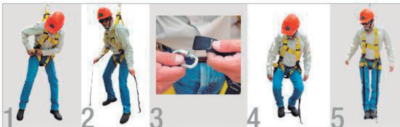
1. Abrir el velcro y jalar la cinta de poliéster que se encuentra dentro del termocontraible.